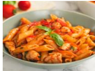
Pasta & Reisgerichte