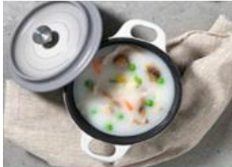
Suppen & Eintöpfe