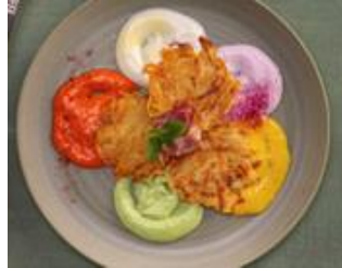
Kartoffel- & Gemüseprodukte