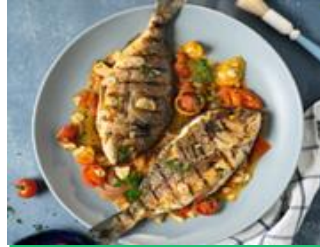
Fertiggerichte Fisch & Fischalternativen