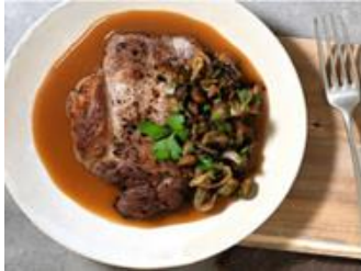
Fertiggerichte Fleisch & Fleischalternativen